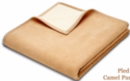
Pled 150x200 Camel Pure Nature Biederlack wełna 50% + 50% bawełna

Link do produktu: https://www.poduszka.com.pl/pled-welniano-bawelniany-5050-camel-pure-nature-biederlack-p-207.html