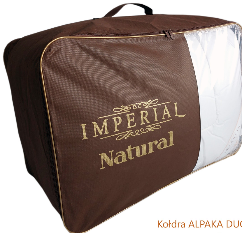
Kołdra ALPAKA DUO zimowa

W ofercie sklepu kupić można zimowe kołdry wykonane w 100% z wełny Alpaki.